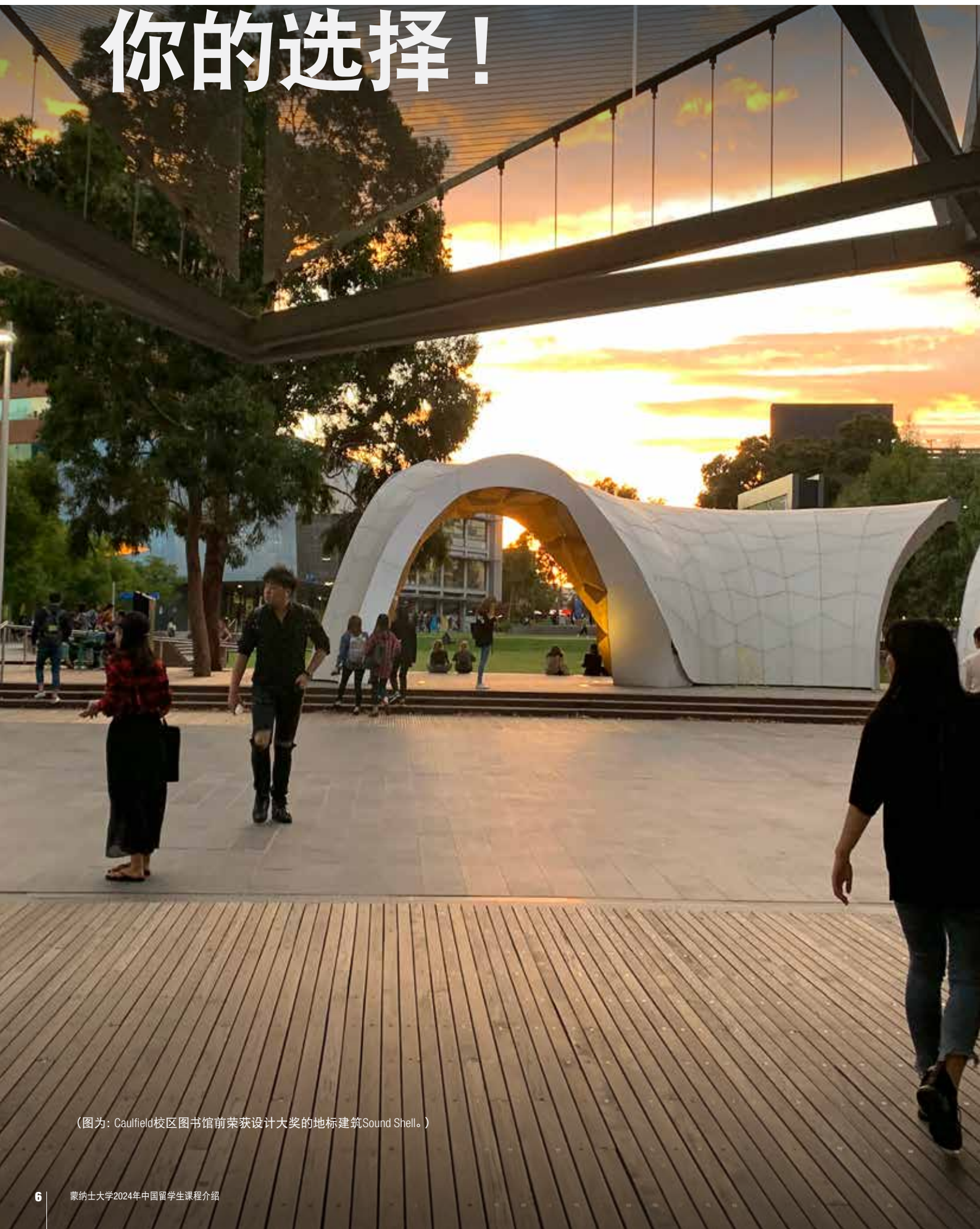
(图为：Caulfield校区图书馆前荣获设计大奖的地标建筑Sound Shell。)