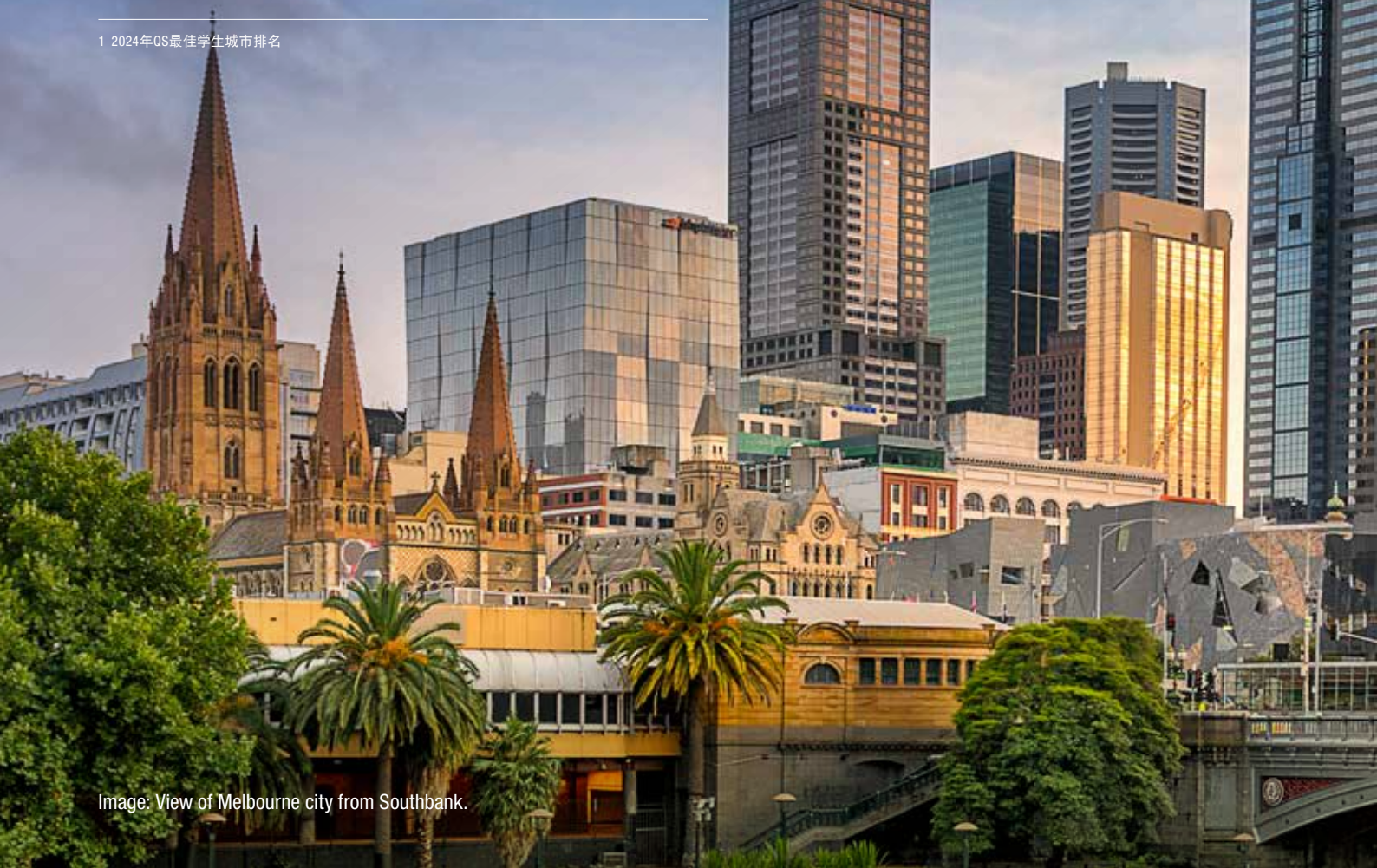
Image: View of Melbourne city from Southbank.